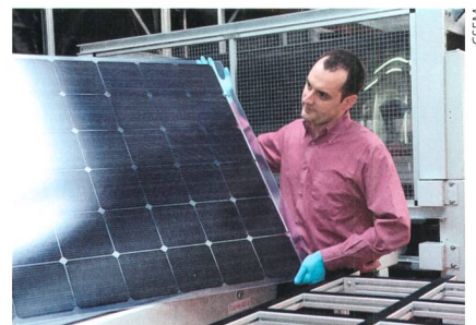
Lamination des modules photovoltaïques.

La prochaine étape sera d'intégrer réellement l'écran dans la vitre de l'appareil respiratoire et de rendre l'outil moins encombrant en éliminant certains câbles.