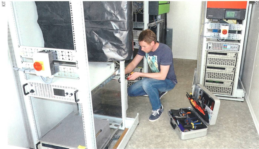
Teststände am KIT, mit denen über 20 kommerzielle Heimspeicher für PV-Strom analysiert werden.

Dazu werden die meisten Systeme, die in Deutschland verfügbar sind, Dauertests in Testständen unterzogen, die die Situation im privaten Haushalt nachstellen. Durch spezielle Belastungsprofile wird es möglich, Sicherheitseigenschaften nicht nur im fabrikneuen Zustand der Batterien zu untersuchen, sondern auch in Alterungszuständen, wie sie nach einigen Jahren Betrieb auftreten. Bei diesen Tests werden auch Daten zur Energieeffizienz und Haltbarkeit ermittelt. No