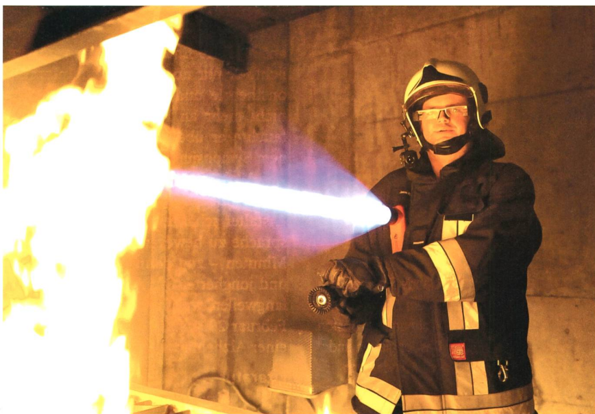
Le prototype est composé, pour l'instant, d'une caméra et d'une paire de lunettes de réalité augmentée.