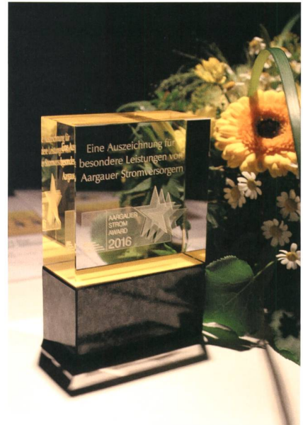
Anerkennung für besondere Leistungen: Trophäe des Aargauer Strom Awards 2016.

der zunehmenden Regulierung und dem schärferen Wettbewerb geht zuweilen unter, wie viel die Stromversorger leisten. Der Aargauer Strom Award soll ihnen in Erinnerung rufen, dass sie auf das Erreichte stolz sein dürfen. Die Auszeichnung für besondere Leistungen wird alle zwei Jahre vergeben. Die VAS-Mitglieder können sich mit konkreten Projekten darum bewerben. Eine fünfköpfige Fachjury mit Vertretern aus Energiebranche, Politik, Verwaltung, Medien und Wirtschaft bewertet die eingereichten Projekte nach verschiedenen Bewertungskriterien. Dazu zählen etwa Innovationskraft, Wirkung und Nachhaltigkeit. Anstelle eines Preisgeldes erhält der Gewinner eine Trophäe, die sein Engagement sichtbar macht. Zudem dürfen sich die Mitarbeitenden der teilnehmenden Energieversorger über ein «Award-Znüni» freuen.