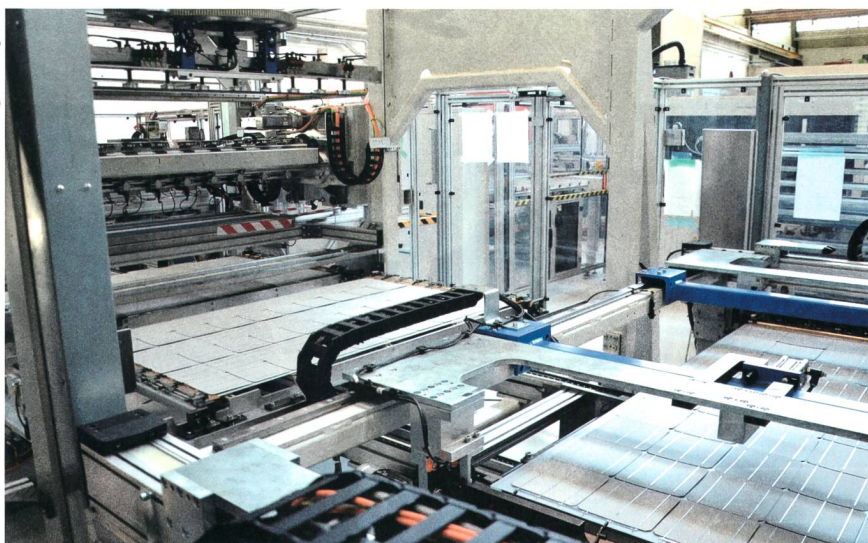
Vollautomatisches Lay-up in der Solar modul-Produktion in Deitingen.