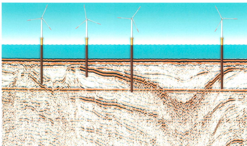
Ein mehrkanalseismisches Profil zeigt den Verlauf von Bodenschichten.