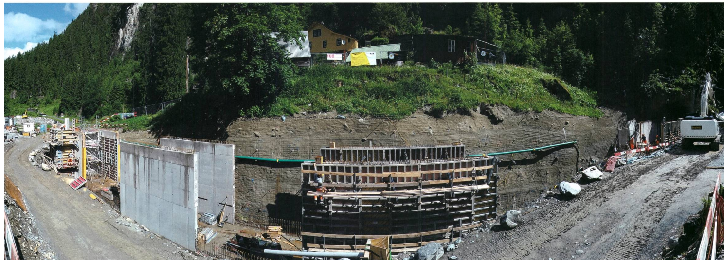
Bild 1 An der Baustelle im Maderanertal sind die Bauarbeiten derzeit in vollem Gang.

Für die Energiequelle Wasserkraft ist das BLN allerdings nicht die einzige Knacknuss. Denn eine Kombination von externen Umständen wie der Subventionierung von Wind und Photovoltaik, dem Preiszerfall von CO 2 -Zertifikaten und tiefen Gas- und Kohlepreisen hat dazu geführt, dass die Marktpreise für Strom aus Wasserkraft zusammengebrochen sind. Dies hat die Schweizer Wasserkraft schwer unter Druck gebracht, weil deren Gestehungskosten in den letzten Jahren tendenziell gestiegen sind.