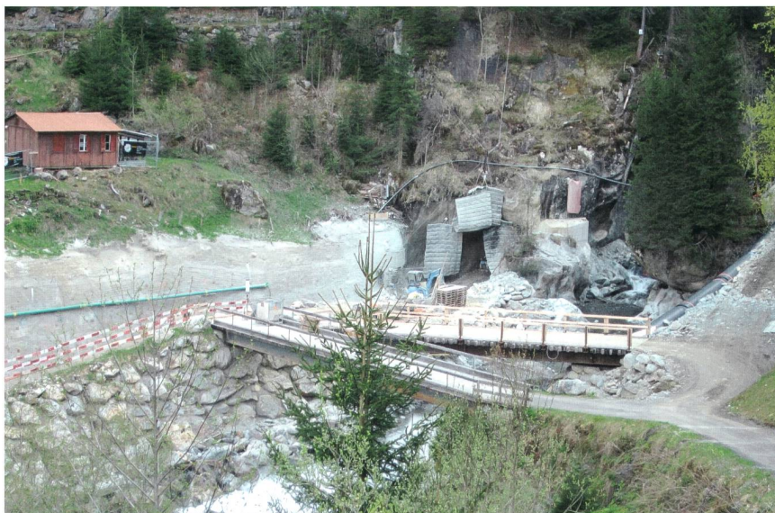
Bild 2 Blick auf die Baustelle der Wasserfassung, die hinter einem Fels versteckt werden wird.

Grund dafür sind insbesondere strengere regulatorische Vorschriften im Hinblick auf Gewässer-, Landschafts- und Denkmalschutz sowie steigende öffentliche Abgaben wie die Verdoppelung des Wasserzinses seit 1997. [2] Der Schweizer Energieriese Alpiq hat so Anfang Jahr seine Wasserkraftwerke zum Verkauf angeboten, was für ein beträchtliches Medienecho gesorgt hat. [3] Doch nicht alle Energieversorger gehen diesen Weg: Andere glauben trotz des Investitionsrisikos weiterhin an die Wasserkraft und sind so auch bereit, den langwierigen und sehr komplexen Planungs- und Bewilligungsprozess auf sich zu nehmen. Das Kraftwerk in Bristen ist ein Beispiel dafür.