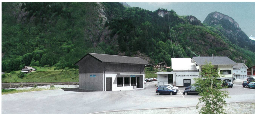
Bild 4 Visualisierung des neuen Kraftwerkgebäudes, das unmittelbar neben der Talstation der Golzernbahn zu stehen kommen wird.

sind lediglich auf die Ausbauwassermenge von 2,6 m 3 /s ausgelegt. Des Weiteren muss sich das Kraftwerk harmonisch in die Landschaft einfügen. Dies gilt einerseits für das Hauptgebäude, für das bauliche Vorlagen (z.B. ein Giebeldach) erstellt wurden. Andererseits sollen auch die Wasserfassung und die 1,8 km lange Druckleitung möglichst unsichtbar bleiben. [6] Erstere soll deshalb hinter einem Felsen versteckt werden ( Bild 2 ), während letztere in unwegsamem Gebiet nahe des eingangs erwähnten Wanderweges unterirdisch gelegt werden muss – eine bauliche Herausforderung ( Bild 3 ).