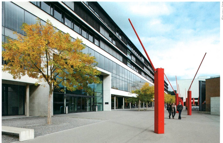
Figure 3 L'imt à l'Université de Fribourg.

Avec ce concept, les membres altruistes ont la possibilité de fournir à des voisins de l'électricité spécifique. D'autre part, les membres égoïstes profitent également de la structure, puisqu'ils ne doivent pas, ou peu, payer de contributions de solidarité pour l'expansion du réseau. Il est également probable que la fusion des cellules iGSL dans une Crowd