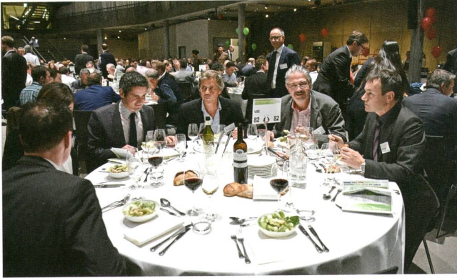
VSE-Kommissionssekretäre unter sich oder geballte Branchenkenntnis an einem Tisch vereint.