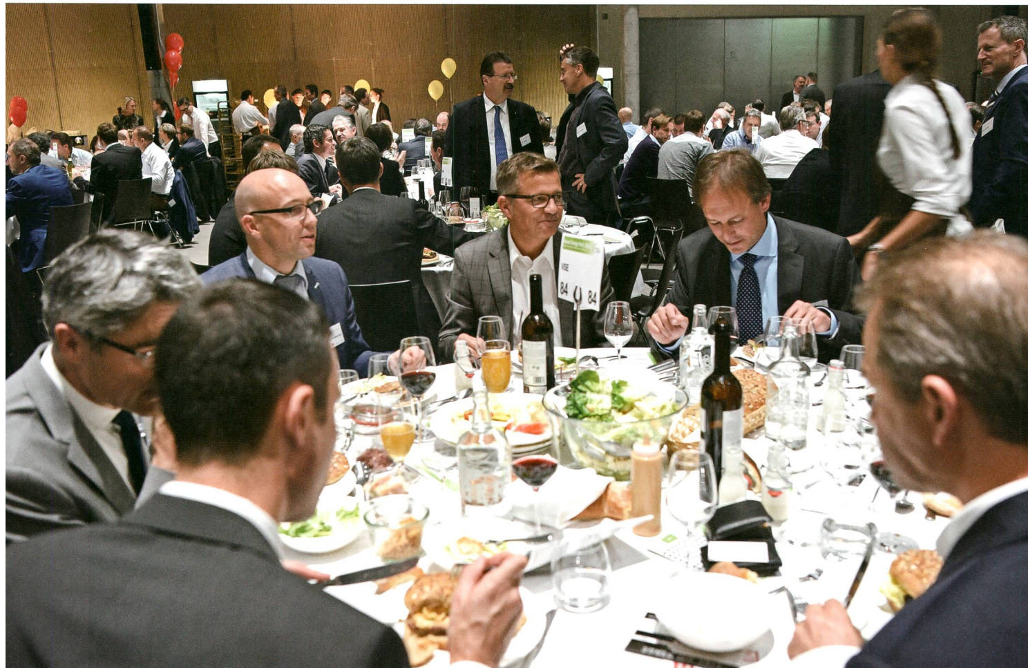
Der VSE empfing an der Smart Energy Party an seinen Tischen Gäste aus Politik, Branche und Wirtschaft.