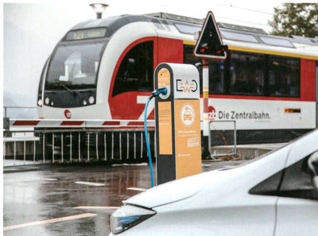
Die Zentralbahn und EWO lancierten an diversen Haltepunkten der Bahn Elektro-Tankstellen.

Die Zentralbahn und das Elektrizitätswerk Obwalden haben in den letzten Jahren zusammen an diversen Haltepunkten der Zentralbahn verschiedene Elektro-Tankstellen eröffnet. Die Nachfrage nach solchen Stromzapfsäulen ist gross, hat doch der Kanton Obwalden schweizweit die höchste Dichte an Elektroautos pro Kopf. Die gemeinsame Lancierung dieser Elektrotankstellen im Kanton Obwalden hat die Jury des Klimapreises, den die Zurich Versicherung vergibt, überzeugt. An der Verleihung des Klimapreises gewann das Konzept den Klimapreis in der Kategorie Transport und Mobilität. Mr