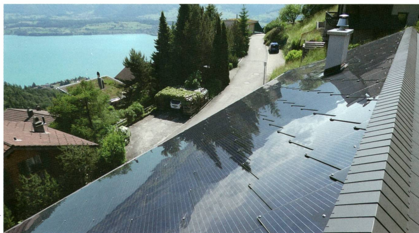
Schweizer Solarpreis 2016

Die dezentralen Erzeugungsanlagen werden zu einem wichtigen Pfeiler unserer Energieversorgung. Dies hat zur Folge, dass nicht nur grosse Kraftwerke, sondern auch kleinere und mittlere Energieerzeugungsanlagen entsprechende technische Anforderungen erfüllen müssen. Diese Veränderungen des Energieerzeugungskonzeptes haben