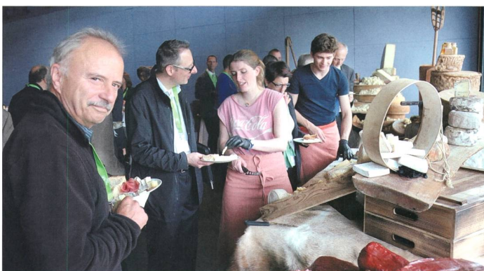
Kulinarisches Networking. Réseautage culinaire. Networking culinario.

quelques événements sur place et des manifestations « Dialogues » à caractère interactif. Le président du CES a fait état que, par tête, en Suisse le nombre d'experts actifs au sein du CES est supérieur à la moyenne. Le taux d'application des nouvelles normes, 99%, est également élevé, tout comme les besoins en normalisation. Il s'agirait désormais de réduire les investissements, d'acquérir de nouveaux experts et d'être en mesure de proposer une assistance active en cas de conflits entre les groupes de travail et les organisations.