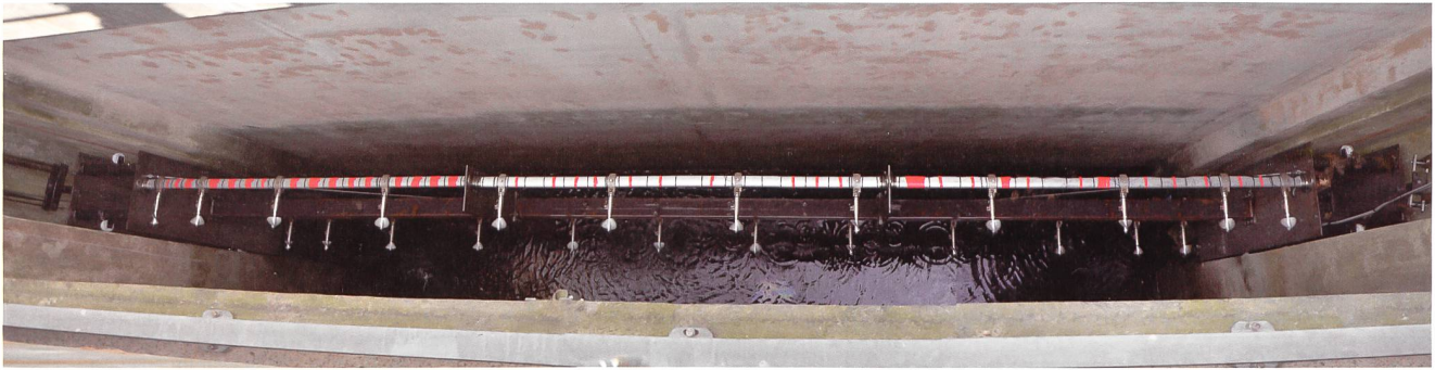
Bild 2 Messflügelmessung mit 24 Messflügeln an zwei horizontalen Tropfenprofilstangen im neun Meter breiten Dammbalkenschlitz beim Gezeitenkraftwerk La Rance, FR.

Garantienachweisen am häufigsten eingesetzte Messmethode ist die thermodynamische Wirkungsgradmessung ( Bild 1 ). Sie basiert auf dem Energieerhaltungssatz, d.h. dem 1. Hauptsatz der Thermodynamik – daher die Namensgebung. Die inneren Verluste (Reibungs- und Dissipationsverluste) einer hydraulischen Maschine verursachen einen Temperaturanstieg des Wassers. Oder anders ausgedrückt, sämtliche nicht in mechanische Energie umgewandelte hydraulische Energie führt zu einer Temperaturerhöhung des Fluids. Der damit berechenbare hydraulische Wirkungsgrad ist bei Turbinen das Verhältnis von zugeführter spezifischer hydraulischer Energie und abgeführter mechanischer Energie. Hierbei können spezifische Energien (Energie pro kg durchströmendes Wasser) eingesetzt werden, da im Zähler und Nenner des Wirkungsgrades der Volumenstrom gekürzt werden kann. Eine Volumenstrommessung ist daher bei dieser Methode nicht notwendig, was den grossen Vorteil, neben der relativ kleinen Messunsicherheit, beschreibt.