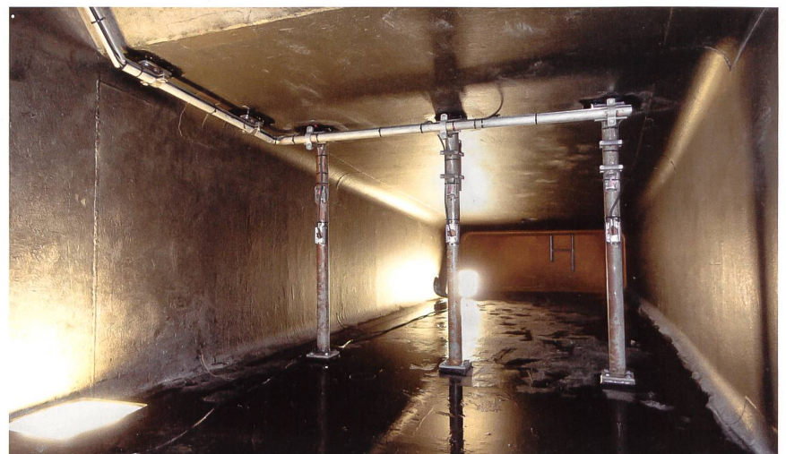
Bild 1 Thermodynamische Niederdruckmessebene mit drei vertikalen Stangen und sechs innenliegenden Temperaturlaufnehmern beim Saugrohraustritt im Hochdruckkraftwerk Filisur, CH.

Die in der Schweiz bei Mittel- und Hochdruckwasserkraftwerken bei