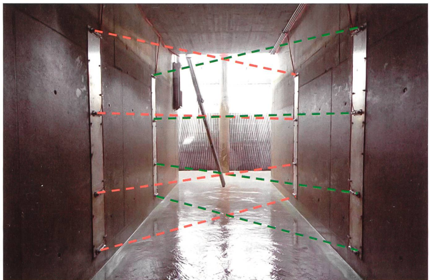
Bild 3 Temporär montierte und mit einem Theodoliten ausgemessene 8-pfadige gekreuzte akustische Volumenstrommessung im Einlaufkanal des Dotierkraftwerks Pradella, CH.

Die akustische Volumenstrommessung ist im aktuellen IEC-Standard 60041 im Anhang (keine Primärmethode) aufgeführt. Um eine absolute Wirkungsgradmessung durchzuführen, sind für die Volumenstrombestimmung vier Ebenen mit jeweils gekreuzten Pfaden erforderlich (d.h. insgesamt acht Pfade). Diese Anordnung ist für einen offenen Kanal in Bild 3 gezeigt. Wirkungsgradmessungen mit akustischen Volumenstrommessungen können sowohl in Nieder- als auch in Hochdruckanlagen angewendet werden