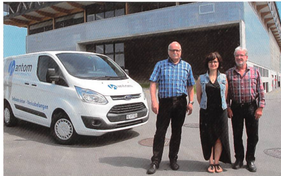
Verkabelungslösungen stehen im Fokus des Hantom-Teams.

Electrosuisse freut sich, folgende Branchenmitglieder willkommen zu heissen! Mitarbeitende von Branchenmitgliedern profitieren von reduzierten Tarifen bei Tagungen und Kursen und können sich aktiv an technischen Gremien beteiligen.