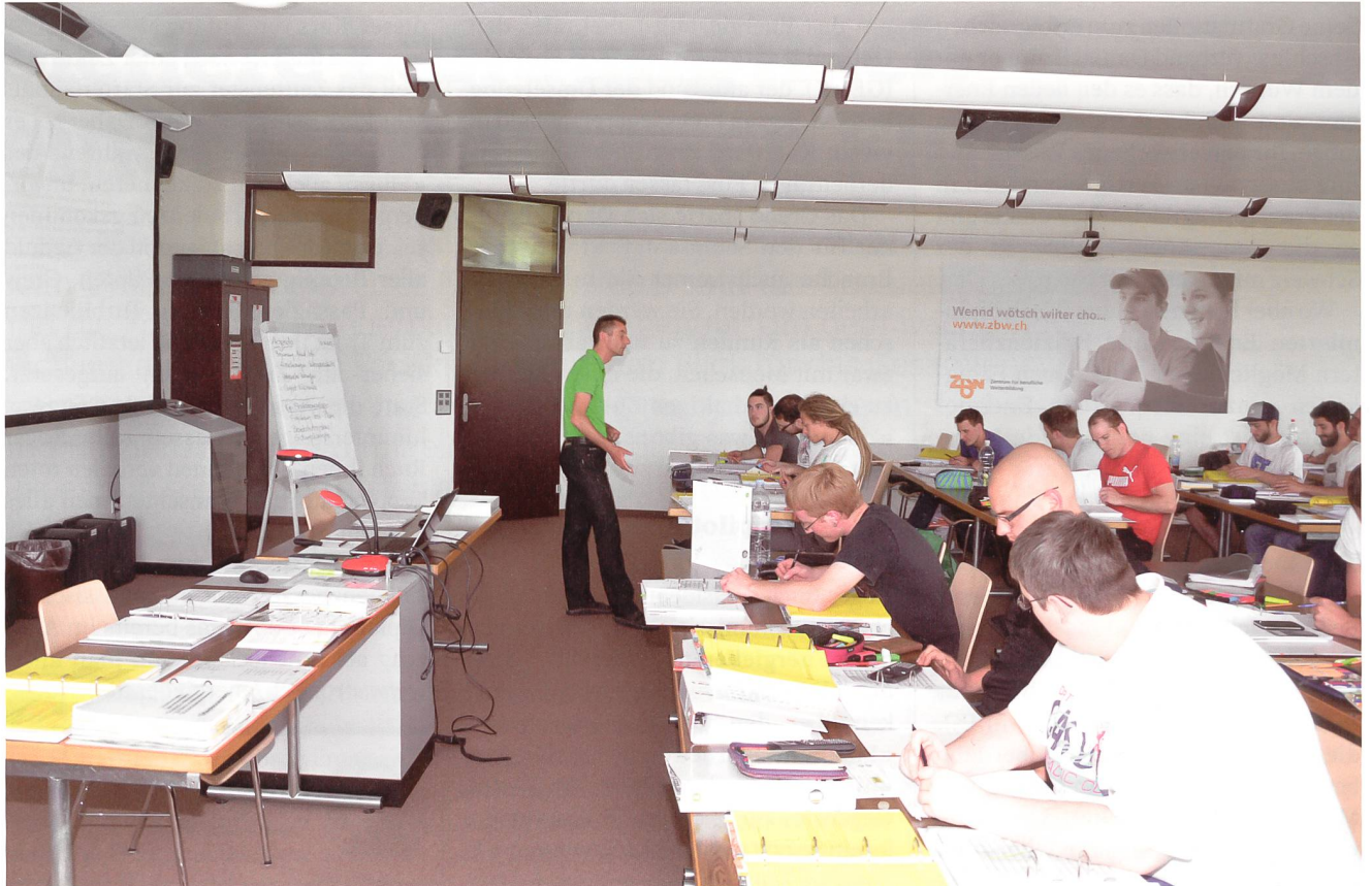
Der Lehrgang «Projektleiter/-in Verteilnetze» stösst stets auf grosses Interesse.