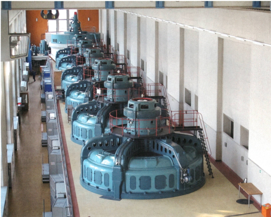
Bild 3: Wasserkraft (im Bild Turbinen im Wasserkraftwerk Mühleberg) ist investitionsintensiv.

perfekten Preiskenntnissen dar. Unter Berücksichtigung realer Anlagen- und Marktrestriktionen (Speichervorhaltung, limitierte Marktgrösse und Unsicherheit über zukünftige Preise) reduziert sich das Einnahmepotenzial deutlich.