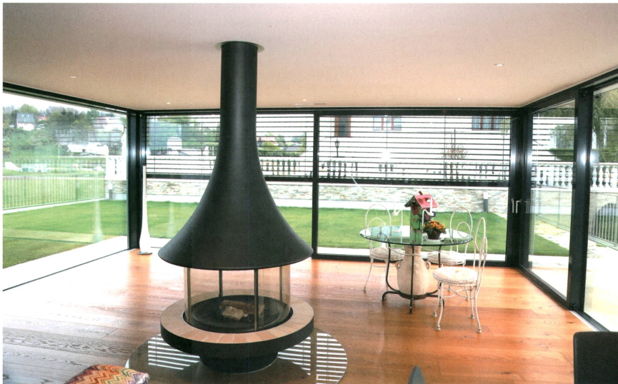
Le couple Di Dio apprécie particulièrement l'automatisme du fonctionnement des stores.