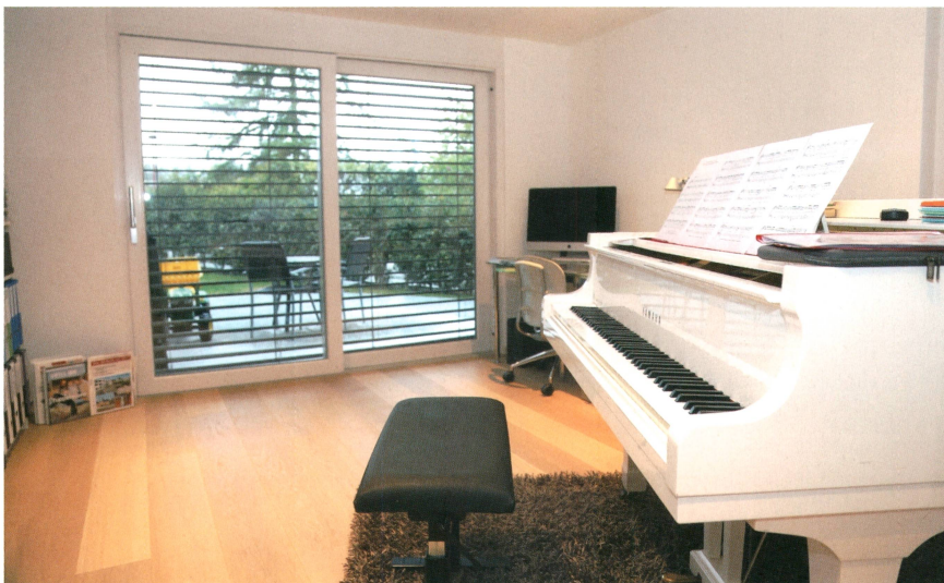
Les possibilités de commande à distance sont très pratiques durant les séances de travail au piano.