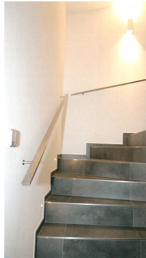
Au milieu de la nuit, seul l'éclairage d'orientation est activé en cas d'appui sur un interrupteur.

chaque pièce au dixième de degré près, ce qui est compatible avec la précision des vannes de thermorégulation utilisées. L'ensemble des appareils KNX, y compris l'appareillage destiné à la sécurité et à la surveillance de l'habitation, est disposé de manière centrale et facilement accessible dans une armoire électrique installée dans les sous-sols respectifs. Une centrale météo fournit les informations nécessaires à la bonne gestion de l'installation.