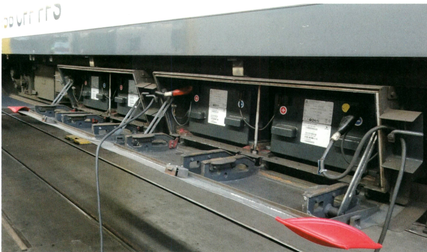
Der Reisezugwagen EW4 führt zwei parallele 36-V-Batteriestränge mit, aktuell in vier Trögen mit je einer 18-V-Bleibatterie untergebracht.