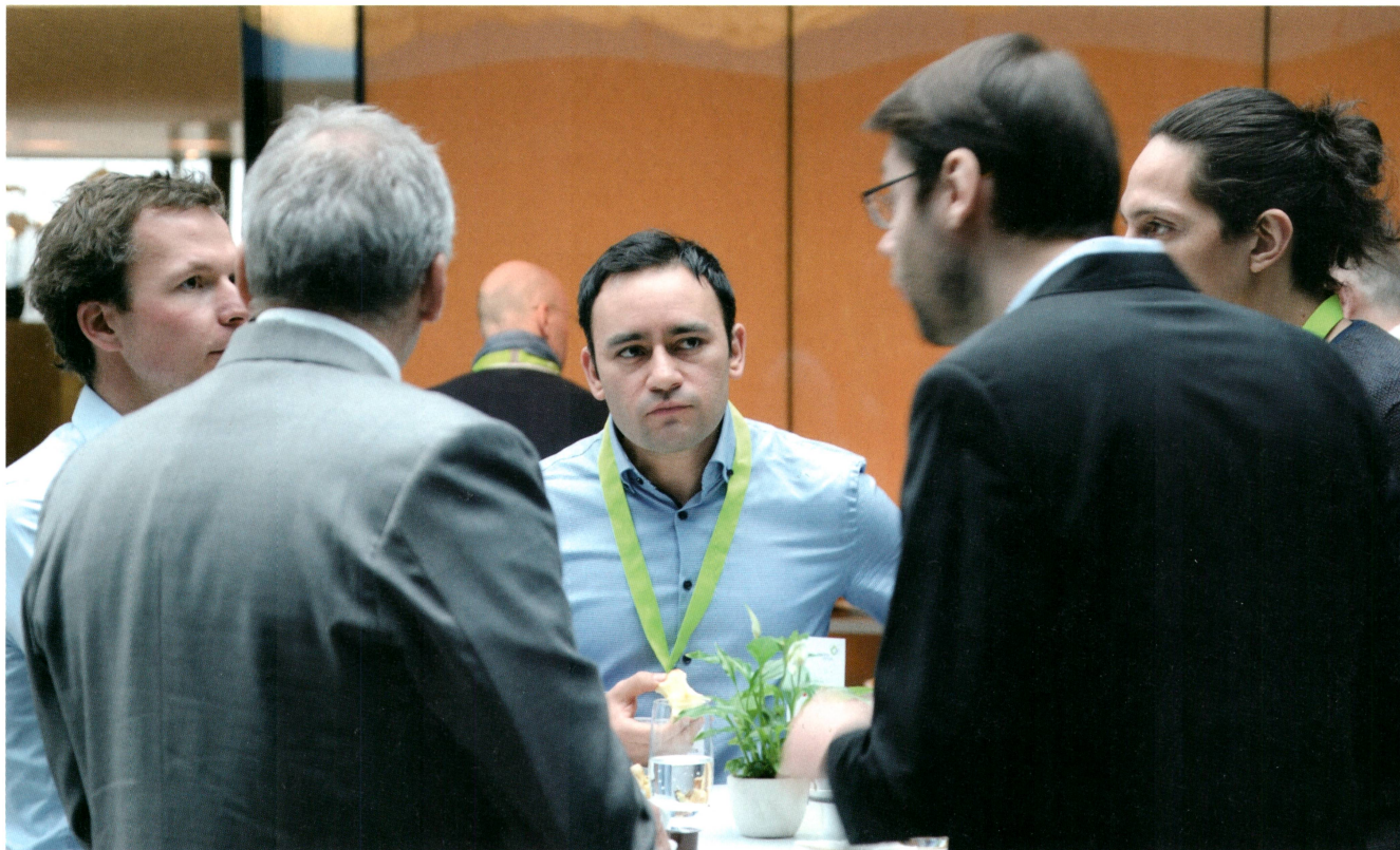
An der Solarbatterietagung in Dietikon konnten Batterieforscher und Vertreter der Industrie ihre Erfahrungen austauschen.