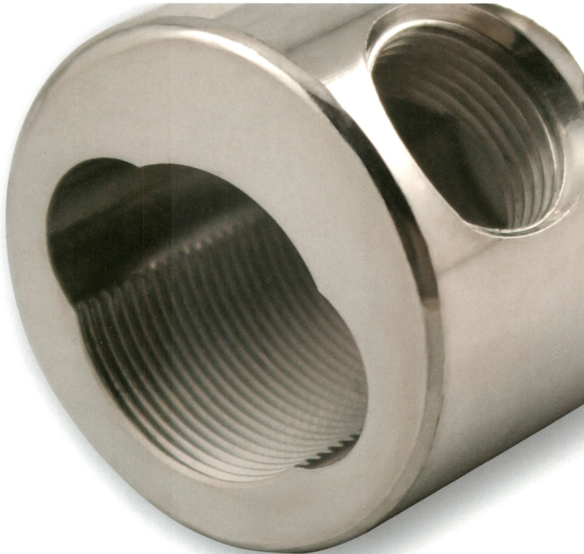
Verbinderkörper mit Sektorkanal