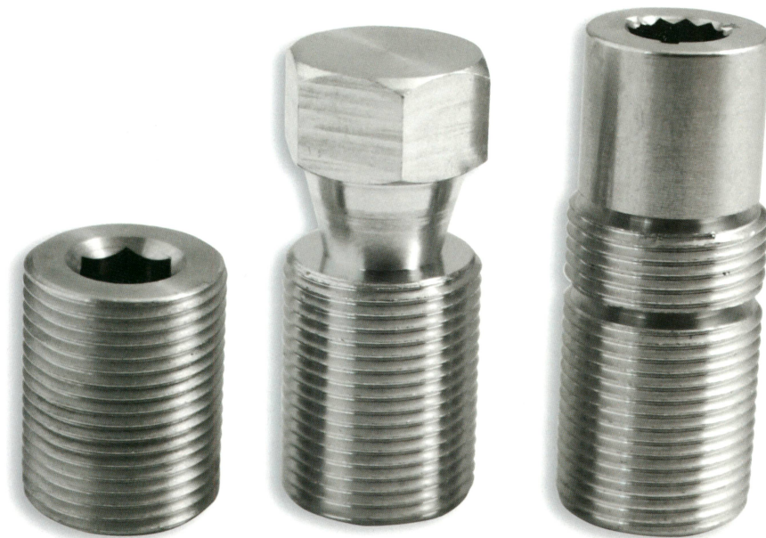
GPH Schraubensystem mit Madenschraube und Abreisskopfschrauben

den. Alle Produkte wurden im Anschluss an die Installationsversuche auf der Werkbank durch umfangreiche Feldversuche getestet und optimiert. Sämtliche Erkenntnisse sind in den Installationsanleitungen berücksichtigt worden.