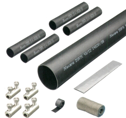
Warmschrumpf-Verbindungs-muffe mit Schraubverbinder, Aufbau basierend auf der Grundlage der DIN 47640.

Als Basis für die neu konzipierte Niederspannungsmuffen (0,6/1 kV) dient die Vornorm DIN 47640, die im Wesentlichen die Minimalanforderungen