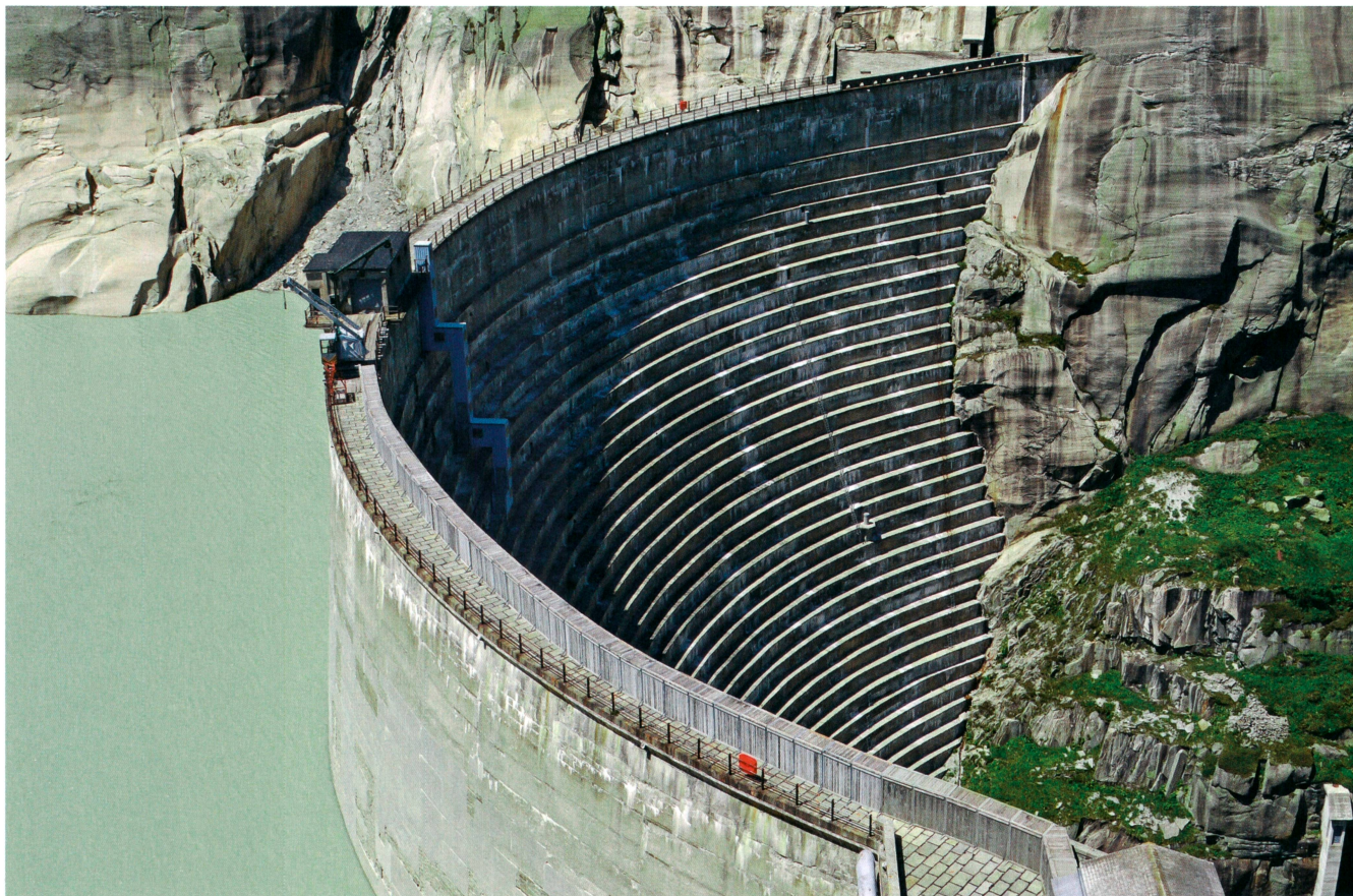
Bild 3 Die Wasserkraft spielt bei der Etablierung eines neuen Marktmodells eine wichtige Rolle.

abgerufenen Leistung entsprechen muss. Im jetzigen Marktmodell wird zwar die produzierte Energie honoriert, es wird aber nichts – oder fast nichts – für die Bereitstellung der abrufbaren Leistung bezahlt.