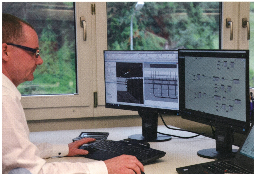
Mitarbeitender der Salzmann AG: Das Modellieren ersetzt das klassische CAD-Zeichnen.

änderungen, werden von den damit verbundenen Objekten automatisch übernommen. Mit einer eindeutigen Zuordnung der realen Anlagenkomponenten vor Ort zum Modell stehen Anlagen- und Betriebsdaten jederzeit online zur Verfügung.