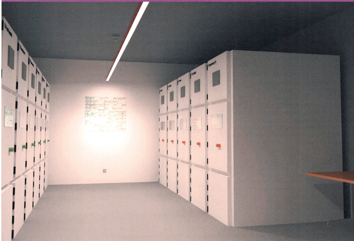
Rendering eines Mittelspannungsraums.