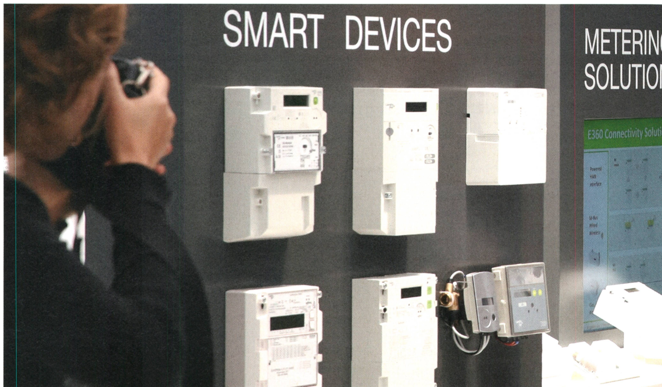
Moderne Smart Meter wie diese sollen schon bald zum Einsatz kommen.