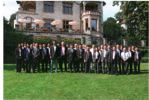
IEC-TC-122-Mitglieder vor der Villa Boveri in Baden.

Am Freitag, 14. September 2018 fand eine Besichtigung der 2015 neu erstell-