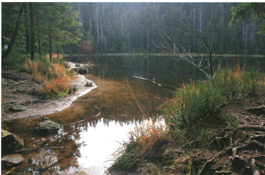
Die Gesetze und Verordnungen zum Schutz der Biodiversität wurden angepasst, was zur Erweiterung geschützter Fläche in der Schweiz um 16 000 Hektaren führte.

Würden alle diese Vorränge zunehmend eingefordert, würden die Stromlieferungen über die Grenze die physikalische Kapazität des grenzüberschreitenden Stromübertragungsnetzes deutlich überschreiten, was zu Systeminstabilität und schliesslich zu einer Gefahr für die Versorgungssicher-