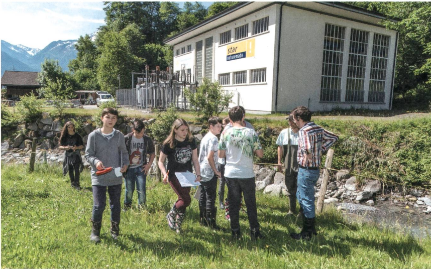
An den jährlichen Umweltbildungstagen der Gemeindewerke Erstfeld erfahren Oberstufenschülerinnen und -schüler vor Ort, wie gefährdete Tierarten vom Ökostrombezug der lokalen Unternehmen profitieren.

An den drei Hauptstandorten von Weleda in der Schweiz, Deutschland und Frankreich wird ausschliesslich mit erneuerbarem Strom produziert. In