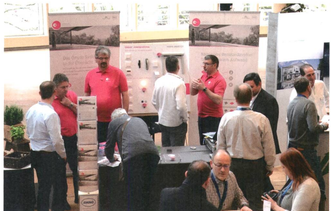
An der begleitenden Ausstellung hatte man Gelegenheit, neue Smart-Home-Systeme kennenzulernen.