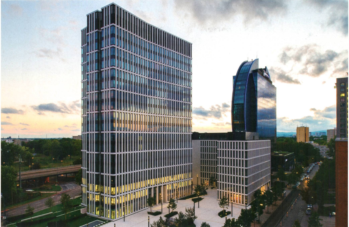
Der St. Martin Tower läutet eine neue Ära der Büroarchitektur in Frankfurt am Main ein.