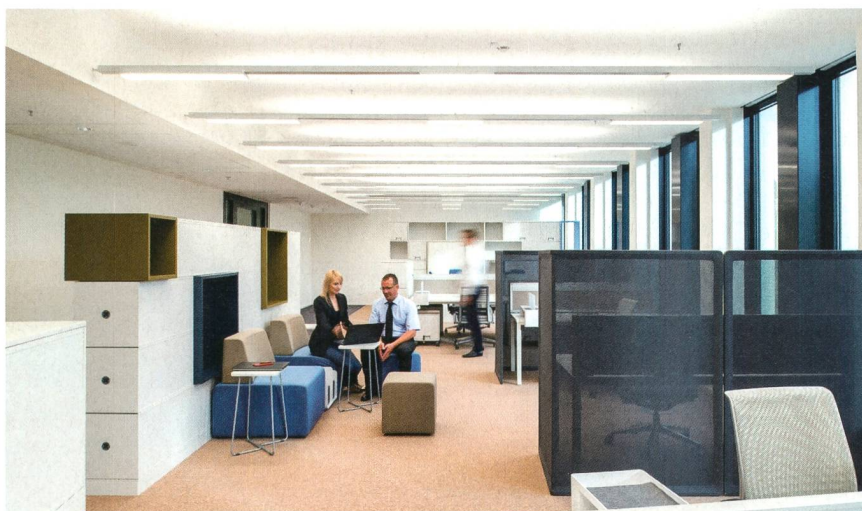
Die bedarfsgerecht an den abgependelten Tragschienen installierten LED-Module schaffen eine angenehme Raumatmosphäre.

Deren Energieverbrauch wird, Prognosen zufolge, noch weiter zunehmen.