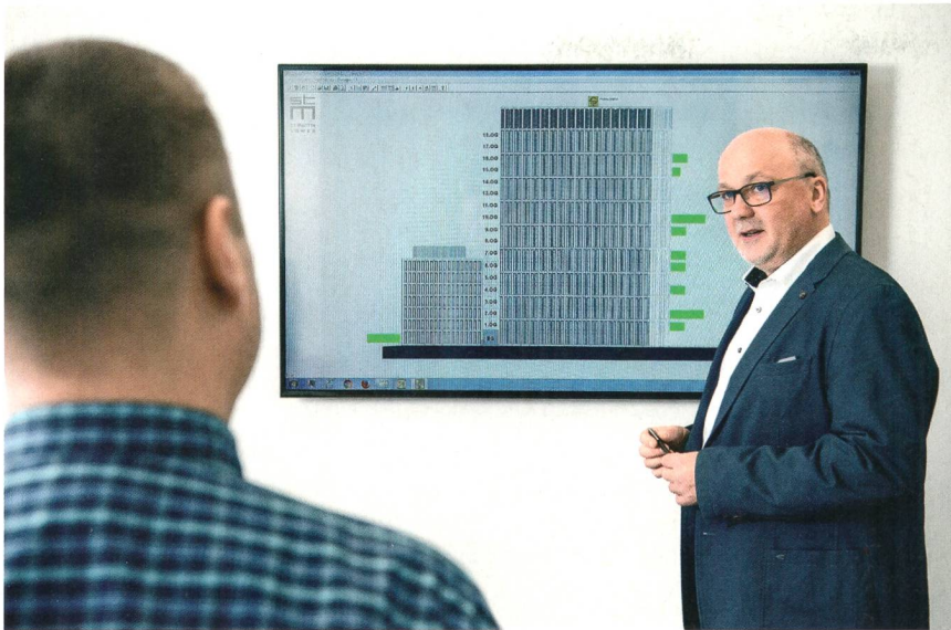
Die Verbindung via Internet ermöglicht neue Möglichkeiten zur Steuerung des Lichts.

Dadurch wird ersichtlich, wie oft Flächen von Mitarbeitern verwendet werden und ob beispielsweise grosse Sitzungszimmer bei seltener Nutzung (10 bis 30% Auslastung) nicht einfach in Bürofläche umgewandelt werden können.