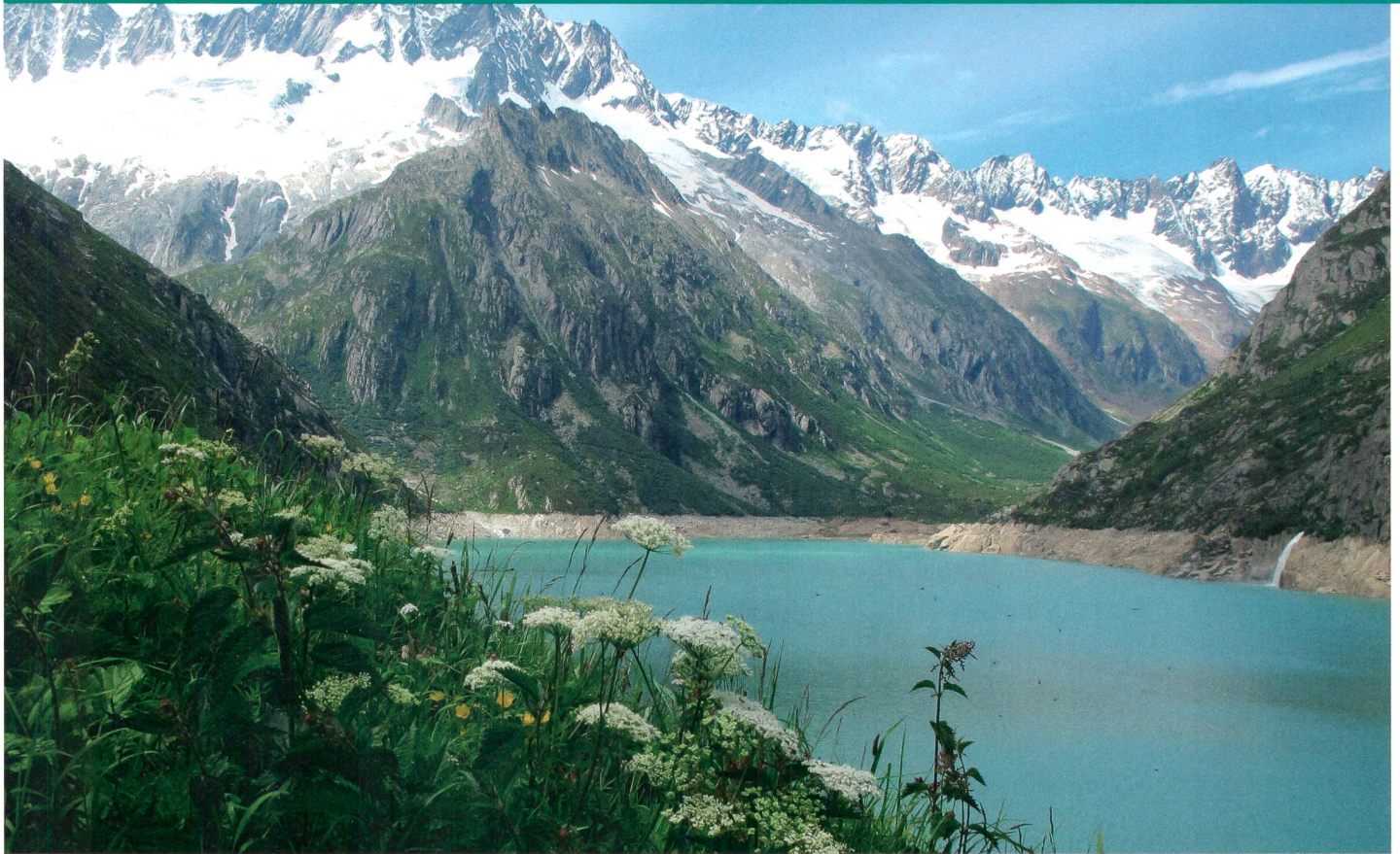
Die Wasserkraft (im Bild der Göscheneralp-Stausee) ist das Rückgrat der Energiestrategie 2050.