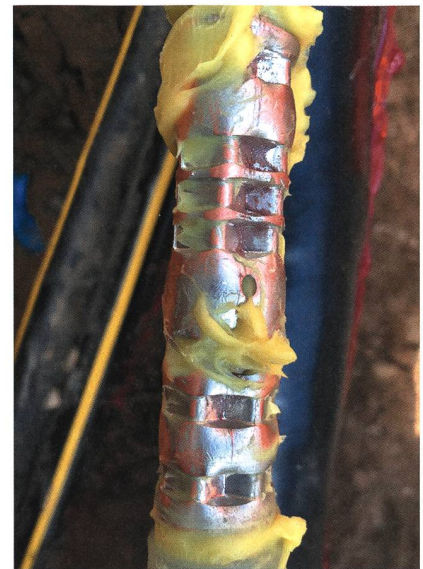
Bild 1 Teilentladungen können beispielsweise durch die Verwendung eines falschen Presswerkzeugs entstehen.

Mantelprüfung: Bei dieser Prüfung wird der Mantelschirm mit einer