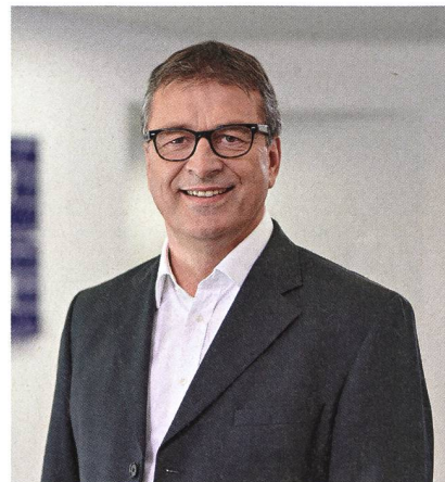
Wolfgang Niedziella wird der nächste Cenelec-Präsident (Amtszeit von 2022 bis 2024) sein.

Beim Thema «Brexit» ging es darum, ob man die Übergangszeit bis zum 31. Dezember 2021 verlängert, was angenommen wurde. Bei der Wahl zum