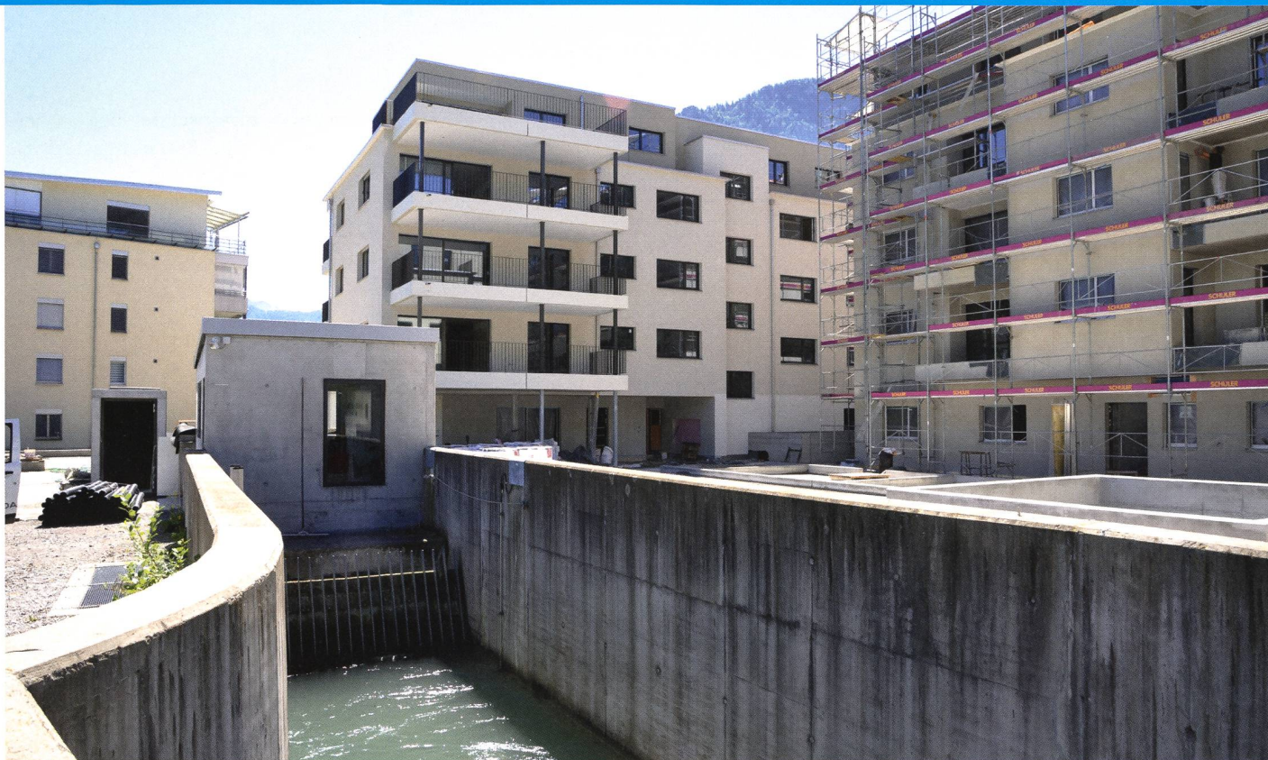
Einlauf des Wasserkraftwerks und zwei der drei Häuser der Überbauung (rechts).