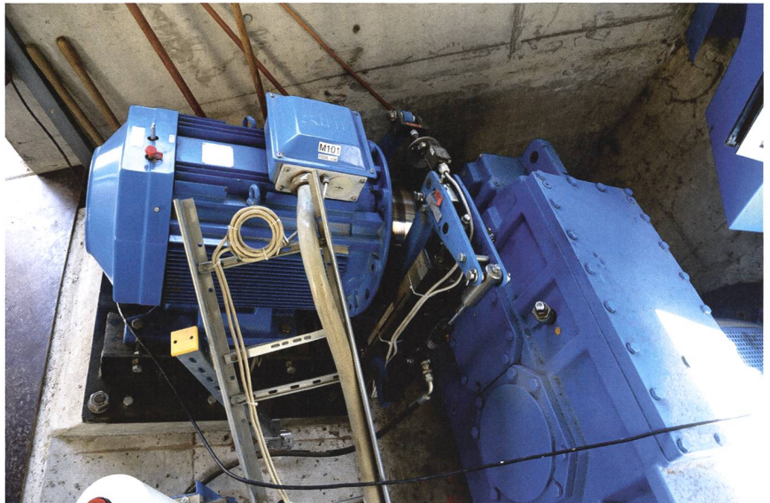
Der Generator hat eine Nenndrehzahl von 1000 U/min, später soll er durch einen mit Nenndrehzahl 1500 U/min ersetzt werden, der etwa 40 % mehr Leistung erzeugt.

Es war schon am Anfang klar, dass man das Autarkieziel mit Solarstrom alleine kaum erreichen kann. Fassadenpanels wurden evaluiert. Selbst PV-Geländer auf den Balkonen, deren Installation dank Normierung und Stangenmaterial, unabhängig von Balkonlänge, relativ einfach gewesen wäre, waren viel zu teuer im Vergleich mit Glasgeländern. Deshalb werden nur die ökonomischeren Flächen genutzt: die Dächer der drei Häuser und der Nebengebäude. Die PV-Nennleistung beträgt nun 120 kW.