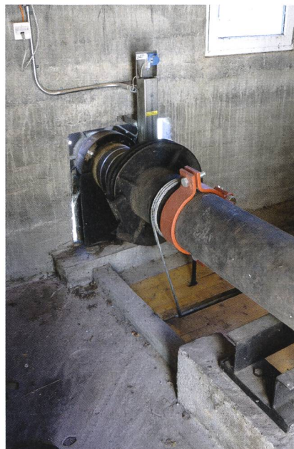
Ein Stahlseil betätigt die Antriebsachse der Stauklappe.

Quais in den Vierwaldstättersee fließt. Da die Schnecke abwärts fischdurchgängig ist und ein Fischaufstieg existiert, fühlen sich die Fische dort wohl. Wo früher kaum Forellen waren, findet man nun auch grössere Exemplare. Wasserkraftschnecken werden deshalb bei Flusskraftwerken auch als Dotierwerke verwendet, mit denen die Energie des Restwassers fischfreundlich genutzt werden kann.