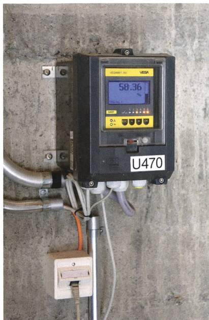
Die Öffnung der Stauklappe wird mit einem digitalen Weggeber überwacht.