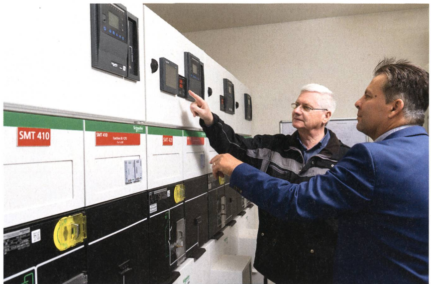
Les données et l'état des systèmes peuvent être consultés aussi bien sur place ...

Les exploitants d'installations et les chefs d'entreprise mettent l'accent sur la détection anticipée des incidents, la restauration immédiate de l'alimentation énergétique et la prévention des causes d'incendie. Dans une telle optique, un intervalle d'intervention purement périodique et statique, tel qu'auparavant défini par UCB Farchim, ne suffit plus. Afin d'obtenir une vision globale et consolidée de l'évolution de l'état de l'ensemble du réseau basse et moyenne tension, les interventions de maintenance devraient dorénavant être menées à la fois de manière continue, évolutive, rapide et rentable. De plus, les installations pourront être surveillées de manière dynamique, localement ou à distance, et contrôlées en conséquence. Des processus numériques analyseront les données et les valeurs enregistrées.