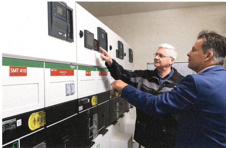
Die Daten und Zustandsangaben der Anlagen können sowohl vor Ort ...

Möglich wird dies durch digitale Prozesse, die aufgenommene Daten und Werte analysieren. Bei UCB entschied