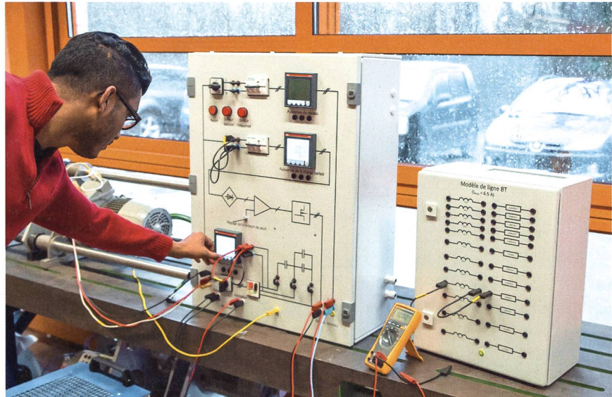
Dans les domaines énergétiques, les travaux pratiques de laboratoire constituent l'un des éléments fondamentaux de l'enseignement.

possible de demander à un ingénieur électricien de devenir simultanément chimiste et thermodynamicien lorsqu'il devra intégrer des batteries ou un stockage à air comprimé dans un réseau; néanmoins, il devra être en mesure de comprendre les éléments les plus importants et les limitations des systèmes non électriques qu'il est censé intégrer, et ce, de manière plus que « superficielle ». Il va sans dire que ces « mariages » vont se multiplier dans les systèmes énergétiques du futur: batteries, réseaux électriques, gaz naturel, hydrogène, chauffages à distance, unités de cogénération, piles à combustible, stockages hydropneumatiques, etc.