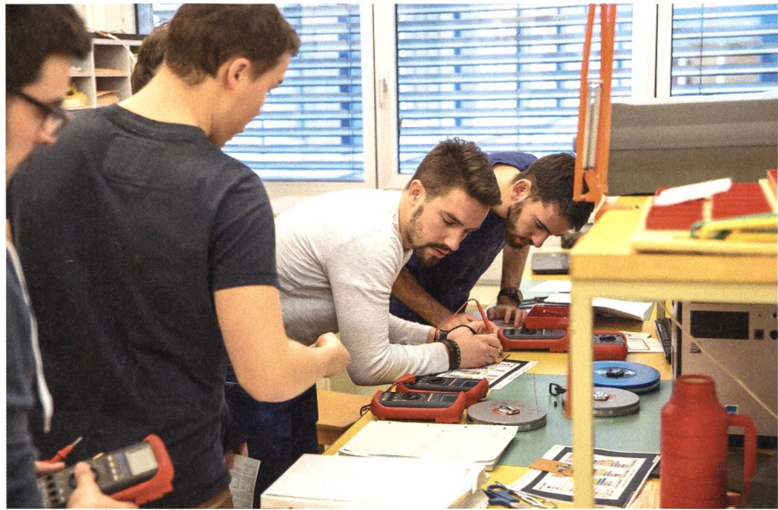
Savoir travailler en équipe: une richesse, mais aussi un défi.

Un autre exemple emblématique: celui du stockage et de son intégration dans les réseaux électriques. Il n'est pas