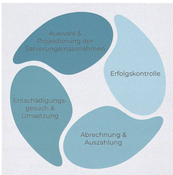
Der Kreislauf der Gewässerschutzsanierung für Wasserkraftanlagen.

Übertragung der Hochspannungsnetze finanziert.[2] So kommen jährlich etwa 50 Mio. Franken zusammen; und dies seit 2012. Allerdings werden nur jene Massnahmen entschädigt, welche nach dem 1. Januar 2011 und vor dem 31. Dezember 2030 eingeleitet wurden.