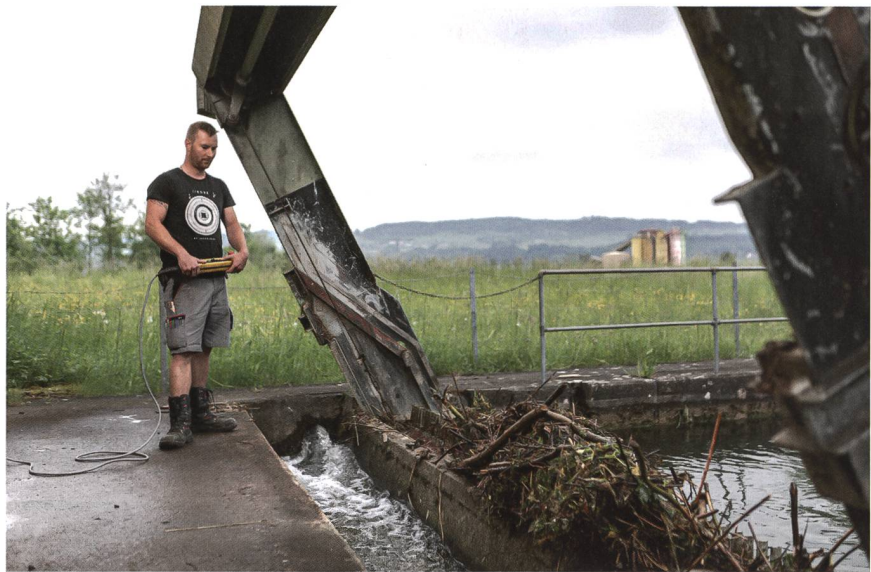
Wasserkraftwerksanlagen müssen punkto Gewässerschutz neuen Anforderungen gerecht werden.

Schwall-Sunk Schwall- und Sunkbetrieb sind negative, unnatürliche Auswirkungen, welche beim Betrieb einer Wasserkraftanlage entstehen können. Sie zeigen sich in den teils grossen Unterschieden der Abflussschwankungen. Schwall entsteht durch Turbinierung und Abgabe grosser Wassermengen ins Gewässer. Mit verminderter Turbinierung, zum Beispiel durch eine geringere Nachfrage an