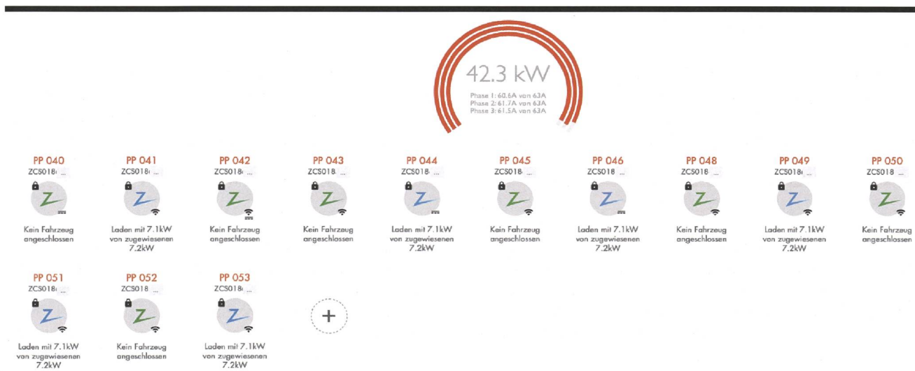
Bild 2 Dynamischer Phasenausgleich in Aktion: Vollständig symmetrische Belastung bei Ladung von sechs zweiphasig ladenden Fahrzeugen.

Um dafür zu sorgen, dass flächendeckend intelligente Ladelösungen eingesetzt werden, die einen Ausbau der Verteilnetze weitestgehend vermeiden, haben Netzbetreiber verschiedene Möglichkeiten. Neben der Pflicht, für den Anschluss von Ladestationen ein technisches Anschlussgesuch (TAG) und eine Installationsanzeige einzureichen, können insbesondere über die Werkvor-