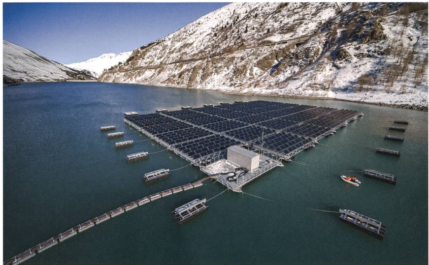
Installations photovoltaïques sur le lac des Toules.

Cette réalité place une fois de plus les questions des importations et de la sécurité de l'approvisionnement en électricité au centre du débat. Autant la branche que la Commission fédérale de l'électricité (ElCom) insistent sur cet enjeu majeur pour la Suisse. L'ElCom a déjà mis en garde à plusieurs reprises contre les risques d'une dépendance vis-à-vis des importations. Elle recom-