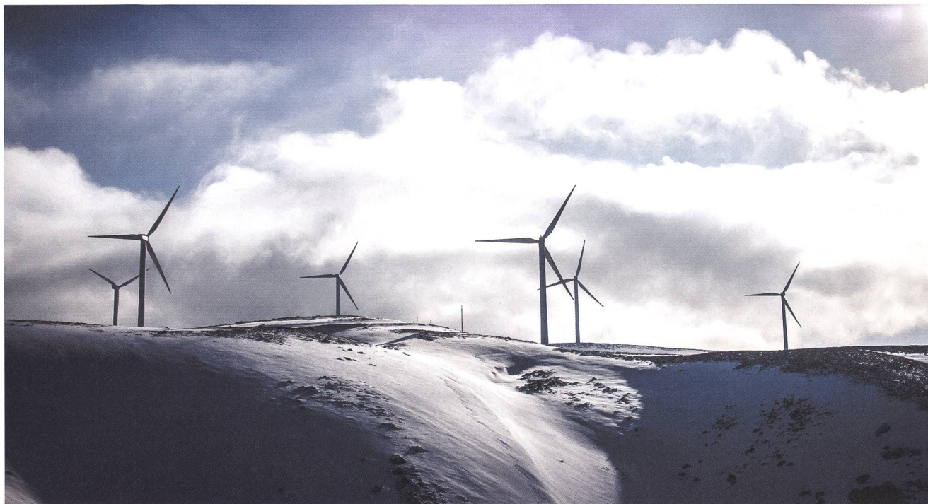
Parc éolien en altitude.