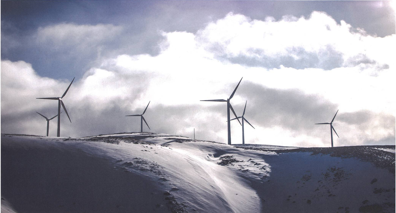
Windpark in den Alpen.