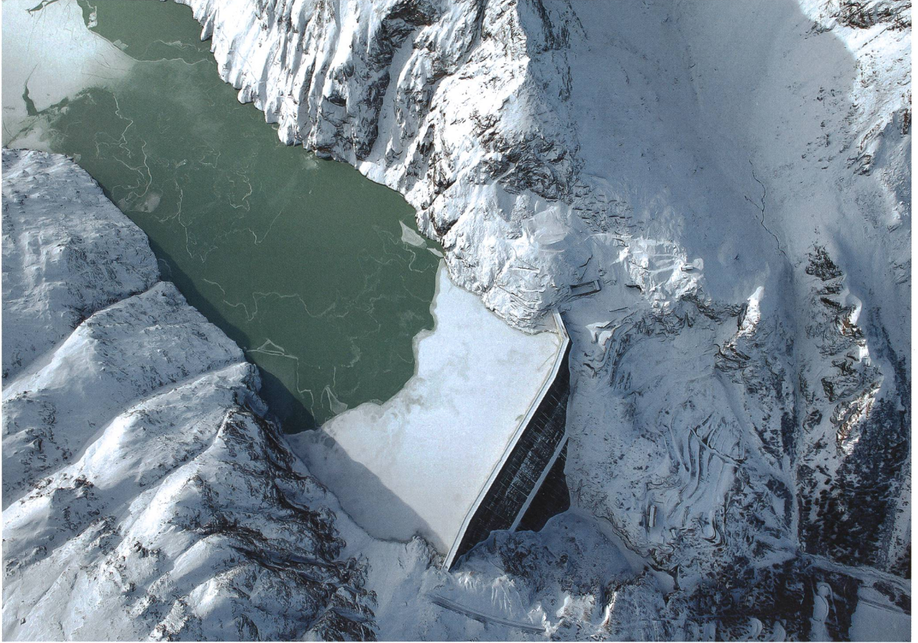
Staumauer Grande Dixence.