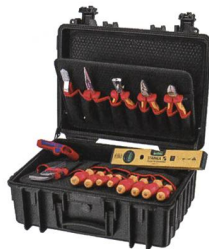
«Robust23 Start» Elektro.

Rutronik Elektronische Bauelemente AG, 8604 Volketswil Tel. 044 9473737, www.rutronik.com/de/schweiz