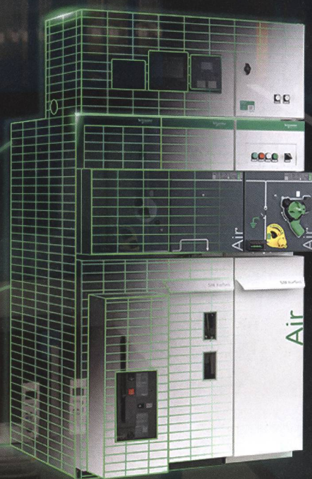
Set Series SM AirSeT

Entdecken Sie SM AirSeT - die neue SF6-freie Mittelspannungsschaltanlage für mehr Nachhaltigkeit und Effizienz.