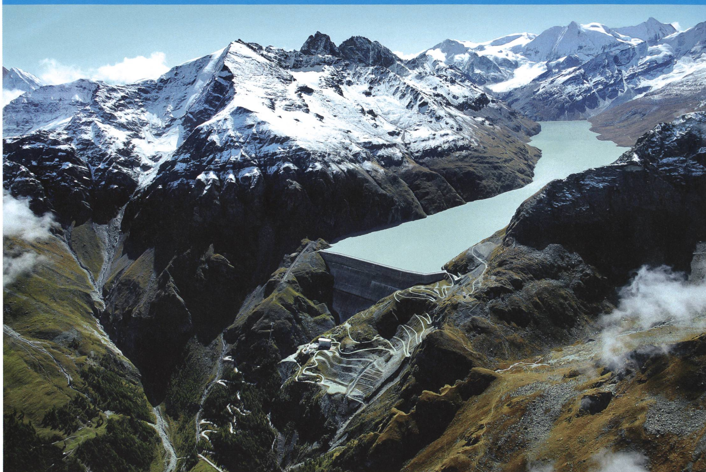
Barrage de la Grande-Dixence.