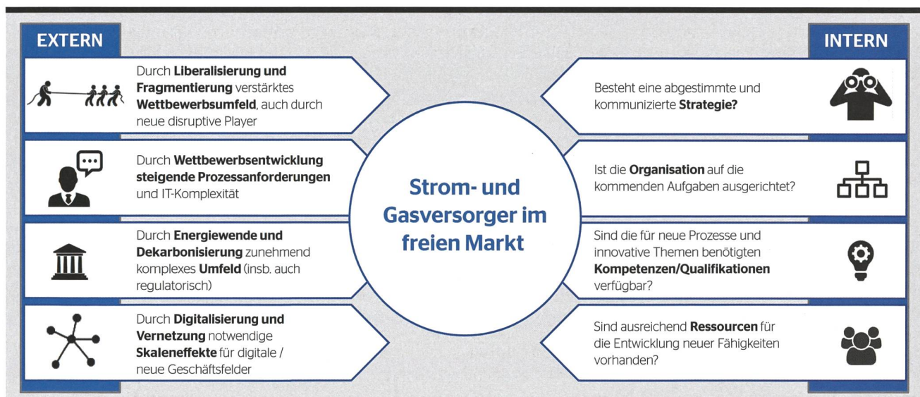
Bild 1 Herausforderungen für Energieversorger im freien Markt.

Die steigende Wettbewerbsintensität und die konstant tiefen Margen im Energiegeschäft lassen heute kaum noch Spielraum für Investitionen und Innovationen offen. Dies ist aber eine Notwendigkeit, will man den Kundenbedürfnissen gerecht werden. Ein hoher Automatisierungsgrad und eine tief durchdrungene Digitalisierung in der Abwicklung sind dabei Grundvoraussetzungen, um den Vertrieb kosteneffizient zu halten. Im Bereich des B2B-Geschäfts sind viele Versorger bereits seit Jahren am Markt tätig und den Umgang mit Kundenbedürfnissen und Mitbewerbern gewohnt, jedoch erstreckt sich die Vertriebsleistung im Wesentlichen auf reaktive Tätigkeiten und nur vereinzelt auf aktive Verkaufsmassnahmen und noch seltener auf gezielte Neukunden-Akquisition. Mit zunehmender Produktvielfalt und steigenden Kundenerwartungen kommen die bestehenden Organisationen an ihre Grenzen, vor allem im Antizipieren der Kundenbedürfnisse.