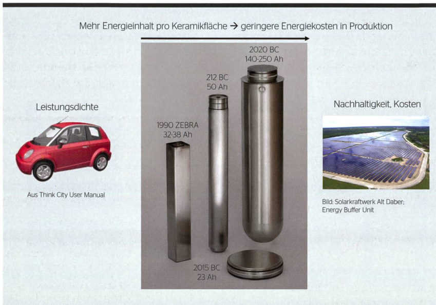
Bild 3 Überblick über die Entwicklung der Zellen von der MES-DEA-Zelle fürs Fahrzeug bis zur Energiezelle mit bis zu 0,5 kWh.

zu vernünftigen Kosten verfügbar sein. Dieser Punkt wird mit grossem Interesse für neue Produkte beleuchtet. Es sollten jedoch die anderen wichtigen Punkte nicht vernachlässigt werden. Nachhaltige Technologien müssen lokal und global eine lebenswerte Umgebung schaffen. Konfliktminerale sind zu vermeiden und es ist global auf sozial- und umweltverträgliche Abbaumethoden zu achten. Geringe Emissionen, lokal und global, sind zentral für ein lebenswertes Klima. Salz Batterien öffnen zudem ein interessantes Feld für die faire Entwicklung. Durch den Betrieb bei mindestens 200 °C sind die Batterien selbst komplett unabhängig von der Umgebungstemperatur. Hermetisch abgeschlossene Batterien erfüllen die IP-69-Norm, was sie vollständig unabhängig von äusseren Bedingungen macht. Dadurch kann die Technologie ohne Weiteres auf der gesamten Welt eingesetzt werden. Die verwendeten Prozesse zur Herstellung sind einfacher als die Verfahren, die für Filmelektroden der Lithium-Ionen-Zellen verwendet werden, und sie können auch in kleineren Betrieben wirtschaftlich dargestellt werden. Die Salz Batterie ist damit ein potenzieller Kandidat für eine Weltbatterie, welche in einem Land für die Verwendung in diesem Land hergestellt wird. Damit kann nachhaltige Entwicklung nicht nur im Sinne der