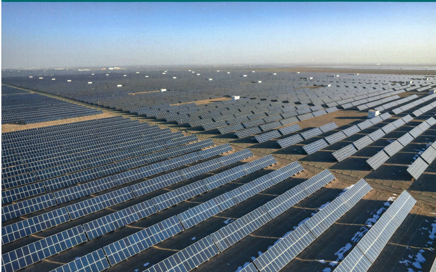
Centrale photovoltaïque à Dunhuang, en Chine.