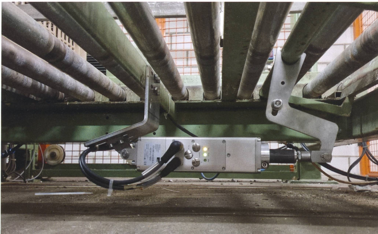
Einsatz von Elektrozyklindern bei Micarna.