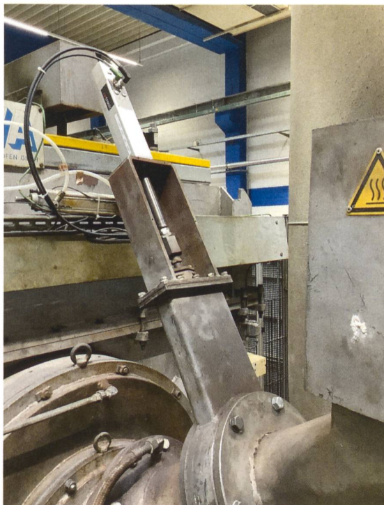
Bild 2 Die Firma Stihl Kettenwerk war eines der Unternehmen, bei denen Druckluftzylinder durch Elektrozyylinder ersetzt wurden.

werden. Grundlage der Berechnung war der Einsatz von Elektrozyindern in mehreren Pilotbetrieben.