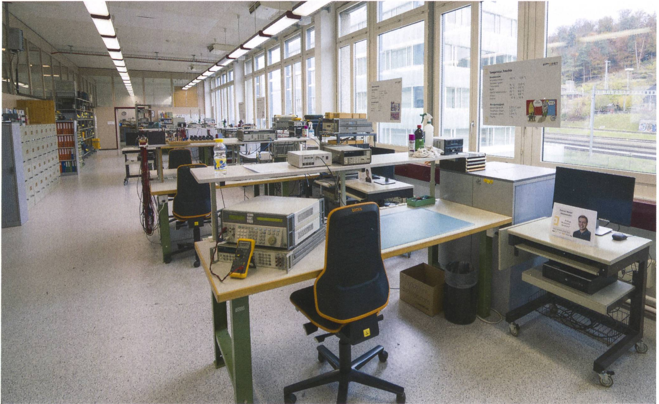
Hauptsitz des SCS-Kalibrierlabors der Aptomet AG in Gümligen bei Bern.