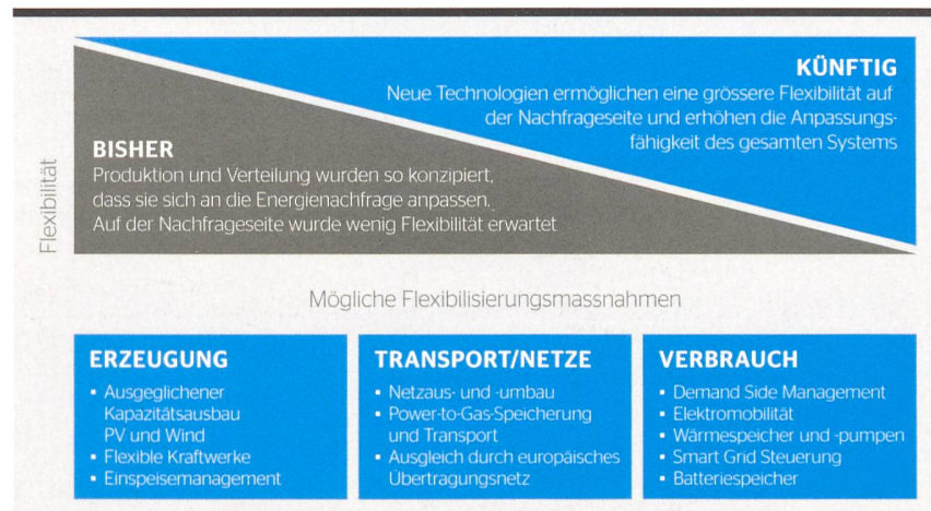
Bild 1 Flexibilisierungsmassnahmen für den Ausgleich zwischen Stromproduktion und -verbrauch.

Um all diese Puzzleteile zwischen Angebot, Nachfrage sowie Strom- und Speichersystemen bestmöglich zu verbinden, braucht es eine Messung der