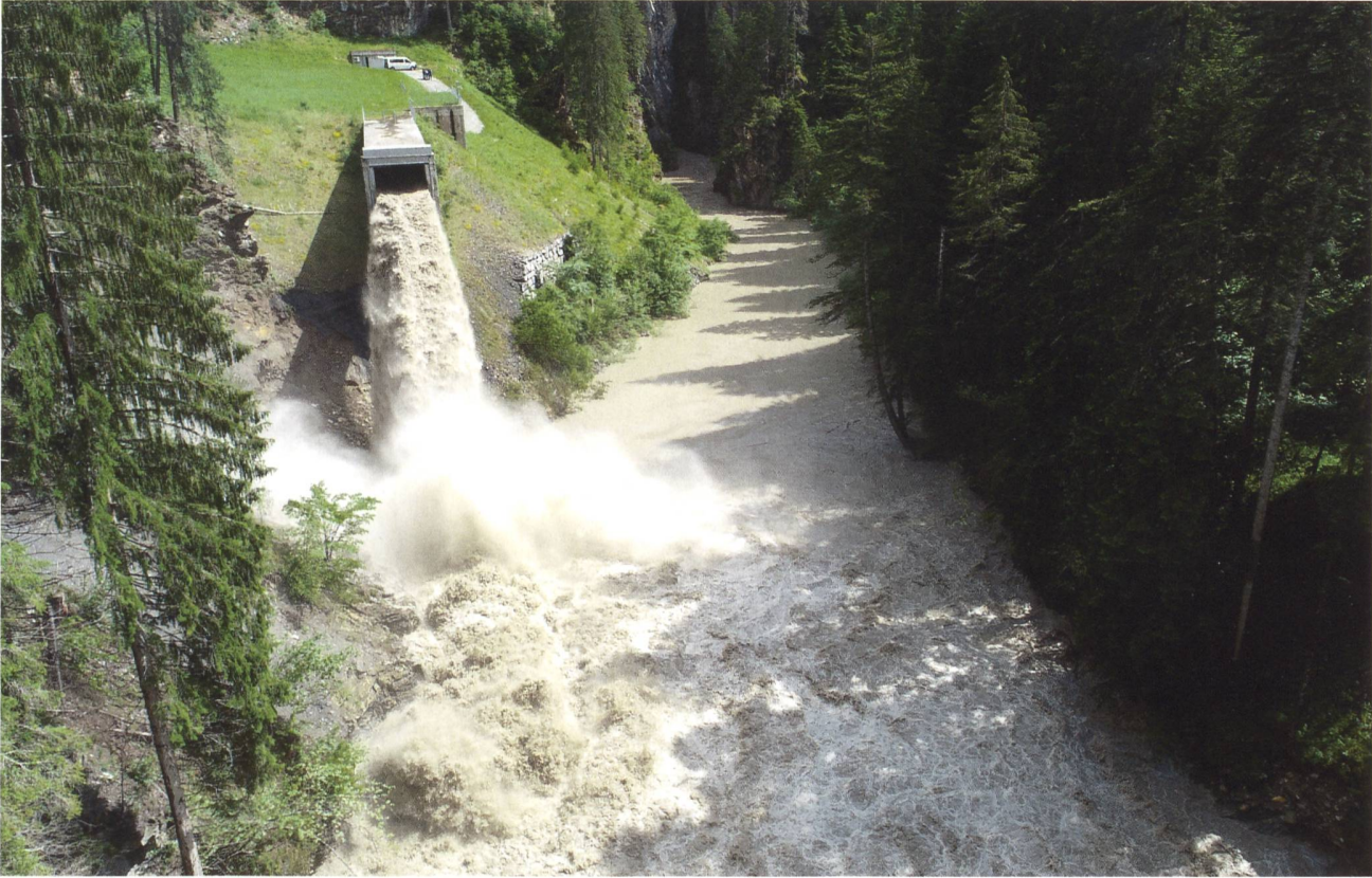
Über den Umleitstollen gelangen Sedimente zurück in die Albula.