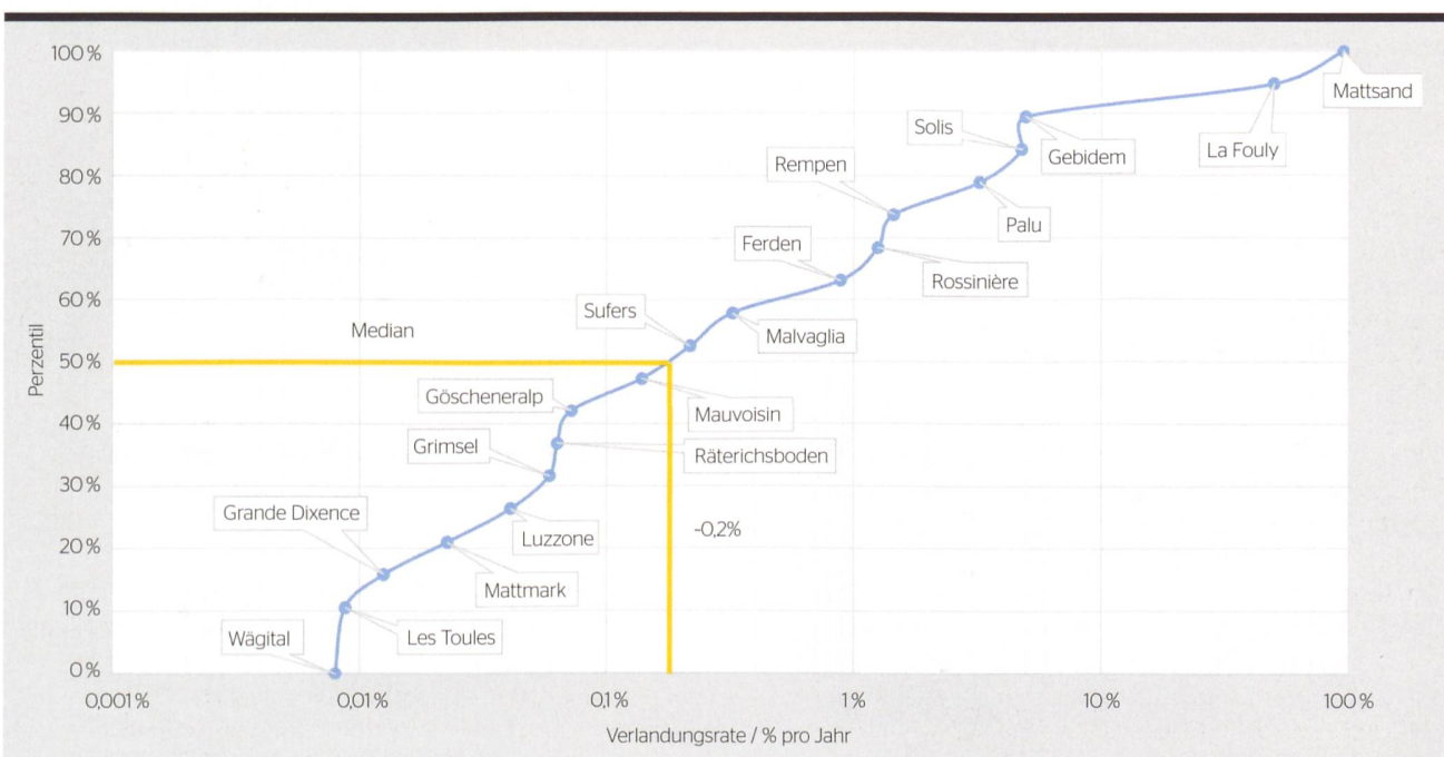
Die Grafik zeigt die Verlandungsrate (abgesetztes Sediment pro Jahr im Vergleich zum Stauvolumen) für ausgewählte Schweizer Stauanlagen unter Berücksichtigung allfälliger Sedimentmanagement-Massnahmen.

Dass Umleitstollen wirksam sind, war schon früher bekannt. Interessant sind die neuen Ergebnisse insbesondere deshalb, weil der Solis-Umleitstollen das sedimenthaltige Wasser nicht beim Zufluss, sondern in der Mitte des Stausees aufnimmt und von dort um die Staumauer führt. «Wir konnten zeigen, dass auch dieser Typ von