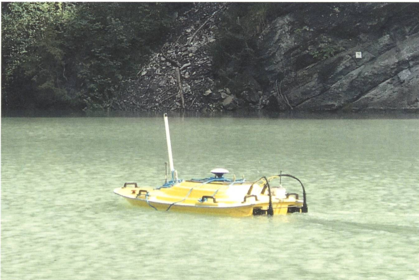
Ein ferngesteuertes Boot mit Messgeräten u.a. für die Erfassung der Höhe des Stauseebodens und der Strömungsgeschwindigkeiten, das vom VAW-Forschungsteam auf dem Solis-Stausee eingesetzt wurde.

men zu erhöhen und damit das durch Sedimente verloren gegangene Wasservolumen zu kompensieren. Dies geschah beispielsweise 1989/91 beim Lac de Mauvoisin (VS). Bei Neuanlagen kann es günstig sein, diese in Nebentälern zu bauen und das Wasser des Hauptgewässers zu fassen und erst nach einer Entsandung beizuleiten. Somit können Sedimente effizient vom Stausee ferngehalten werden.