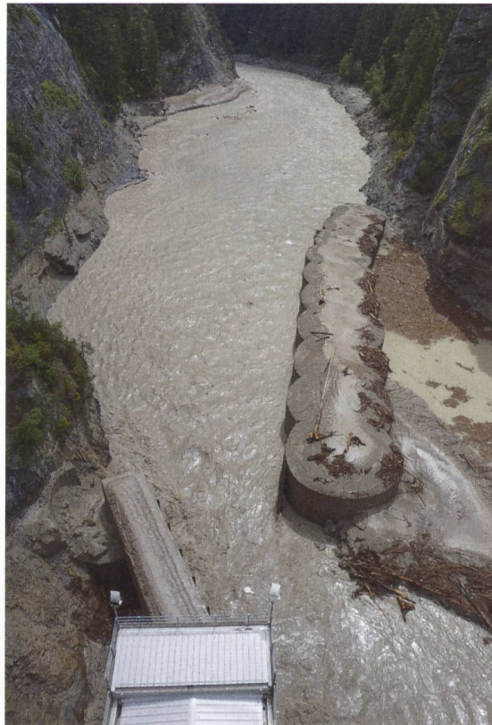
Der Einlass in den Umleitstollen ist links unten zu sehen. Blick gegen die Fliessrichtung der Albula.