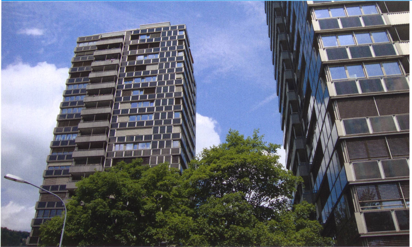
Hochhäuser in der Zürcher Sihlweid mit Solarfassaden.