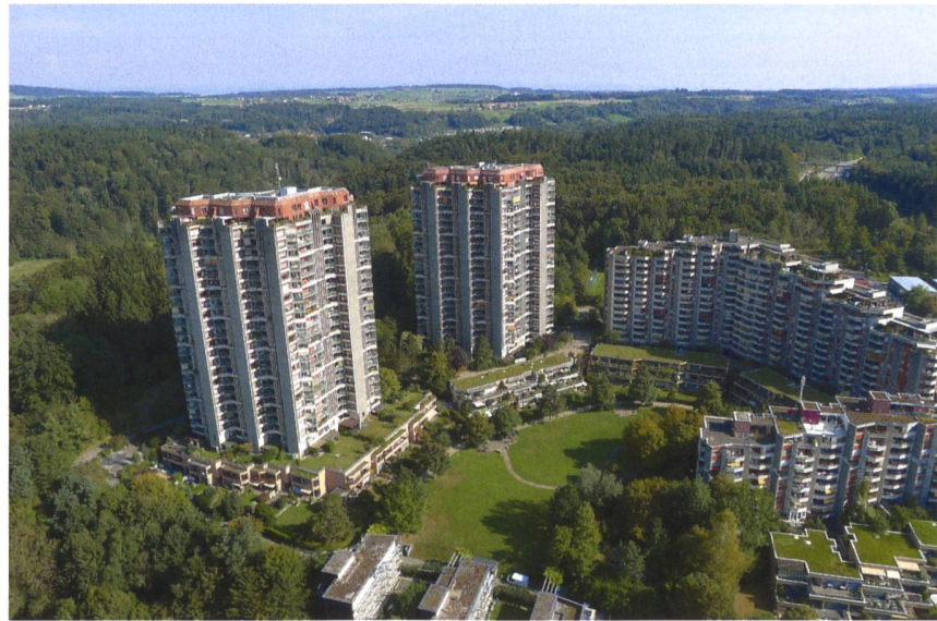
Bild 1 Hochhausssiedlung Holenacker 65 und 85 vor der Sanierung mit PV-Fassaden der Fambau-Genossenschaft.

Netzgekoppelte PV-Anlagen werden seit über 30 Jahren gebaut. Sie sind