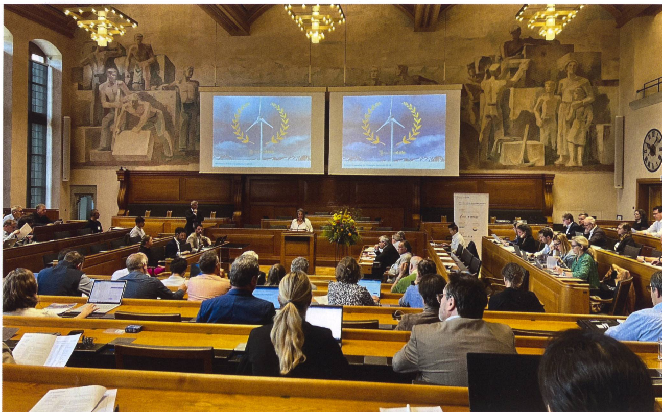
C'est dans le magnifique cadre de l'Hôtel de Ville de Berne que s'est déroulé le Congrès national de l'énergie éolienne 2023.