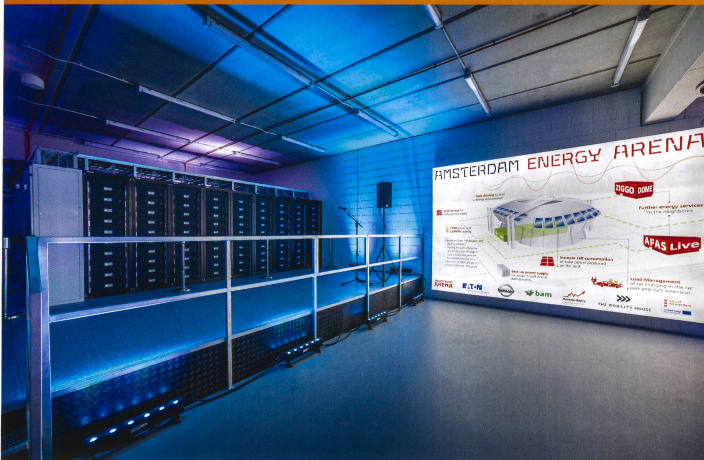
Le système de stockage d'énergie de 3 MW de la Johan Cruyff Arena, aux Pays-Bas, comprend des batteries de véhicules électriques de seconde vie [1].