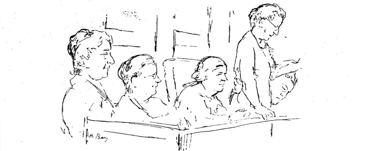
Von der Generalversammlung des Bundes Schweiz. Frauenvereine.