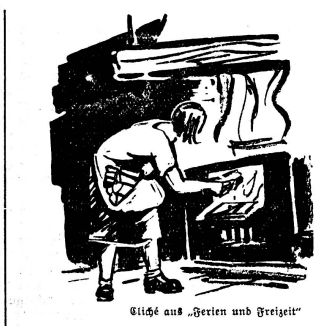
Gleich aus „Serien und Freizeit“