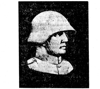
Spendet für die Soldaten-Weihnacht! Postcheck III/7017, Bern